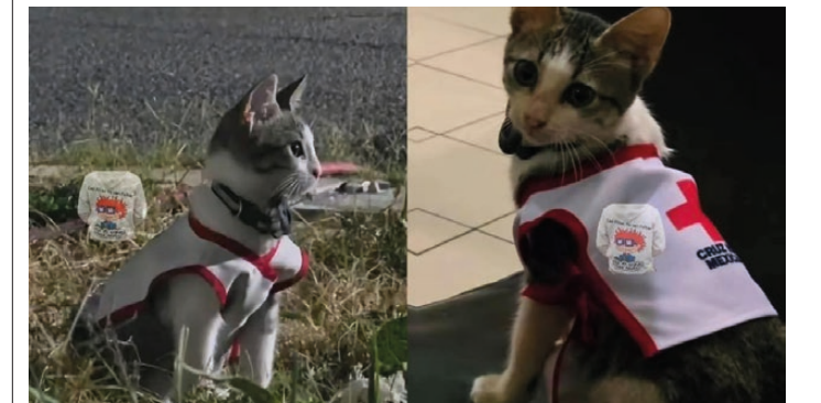
La Cruz Roja de Ciudad Victoria adoptó a un gatito rescatado que ahora forma parte de la institución. El felino acompaña y brinda compañía al personal y voluntariado en sus actividades cotidianas. LUIS TOVAR.