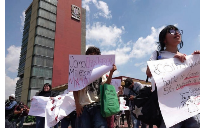
Ciudad de México.- Estudiantes del Colegio de Ciencias y Humanidades (CCH) plantel Sur marcharon sobre Periférico hasta Ciudad Universitaria, donde realizaron una protesta en Rectoría. La movilización tuvo como objetivo exigir justicia y mayor seguridad dentro del plantel. IGNACIO NAVA.