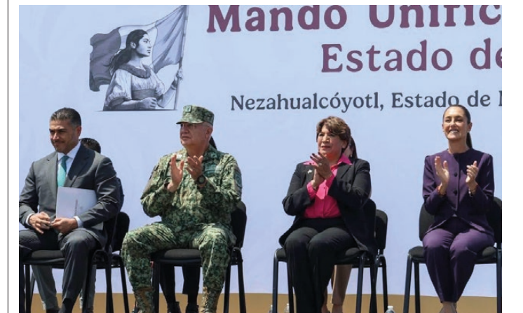
Toluca, Estado de México.- De enero a agosto de 2025, el delito de extorsión registró una reducción del 26% en comparación con el mismo periodo de 2024. Autoridades estatales atribuyen la baja a operativos estratégicos, como Liberación, y a las denuncias ciudadanas realizadas de manera anónima al número 089. IGNACIO NAVA.