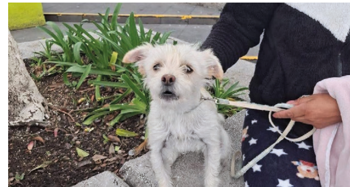
Toluca, Estado de México.- El municipio alcanzó la cifra de 10 mil esterilizaciones de perros y gatos durante 2025, como parte del programa CEVMAR, implementado en diversas comunidades para fomentar la tenencia responsable de animales de compañía. LUIS TOVAR.