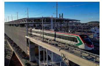
Ignacio Nava, Edomex

Las pruebas dinámicas del Tren El Insurgente han entrado en su fase más intensa y visualmente espectacular, dominando ya el paisaje urbano de la capital. Se están realizando en el tramo más complejo y emblemático de la obra: los últimos 9 kilómetros que conectan Santa Fe con la terminal Observatorio.